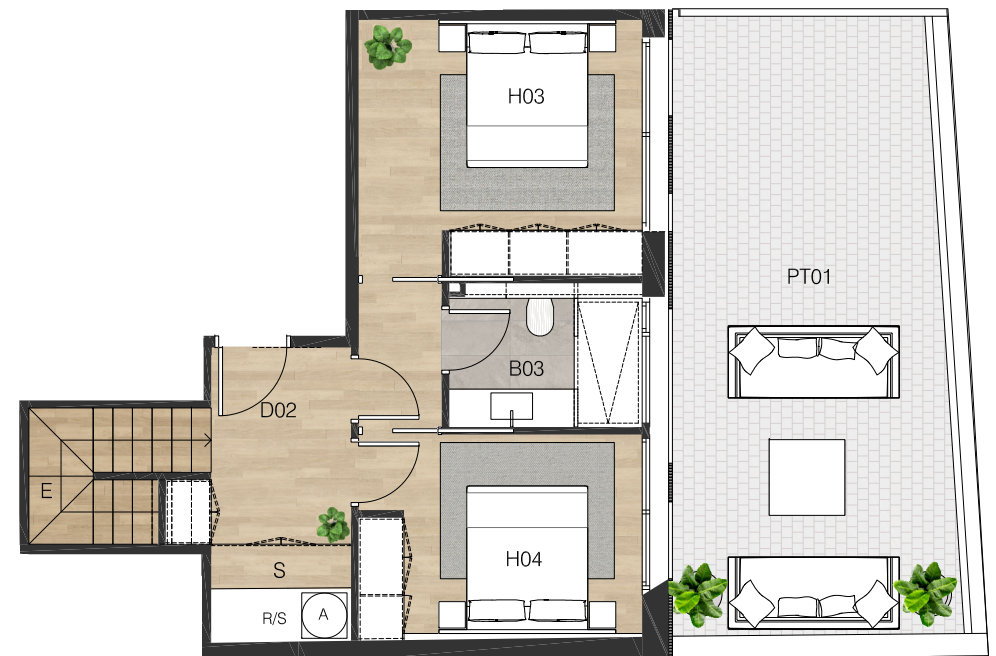
PLANTA HABITATGE 1º·3ª (PB)