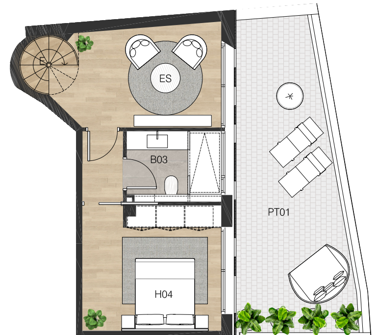
PLANTA HABITATGE 1 o .1 a (PB)